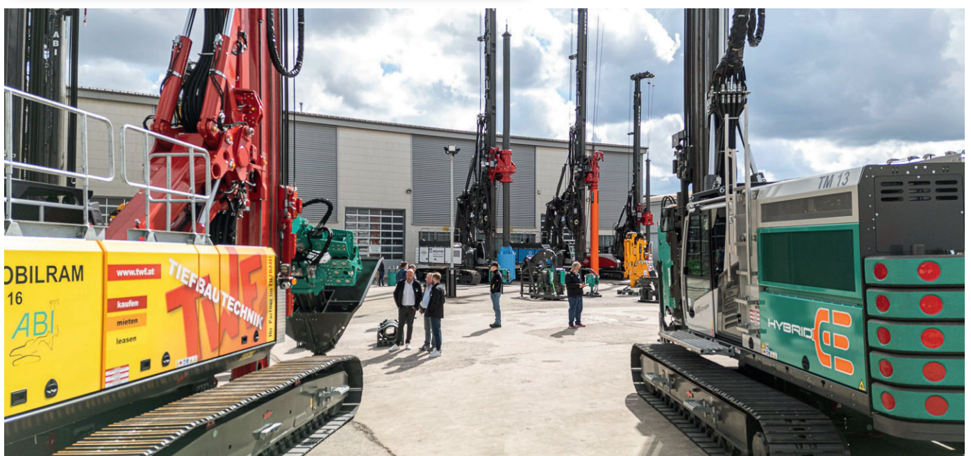
Blick in den Maschinenhof. Zwischen der TM 16 und der TM 13 Hybrid