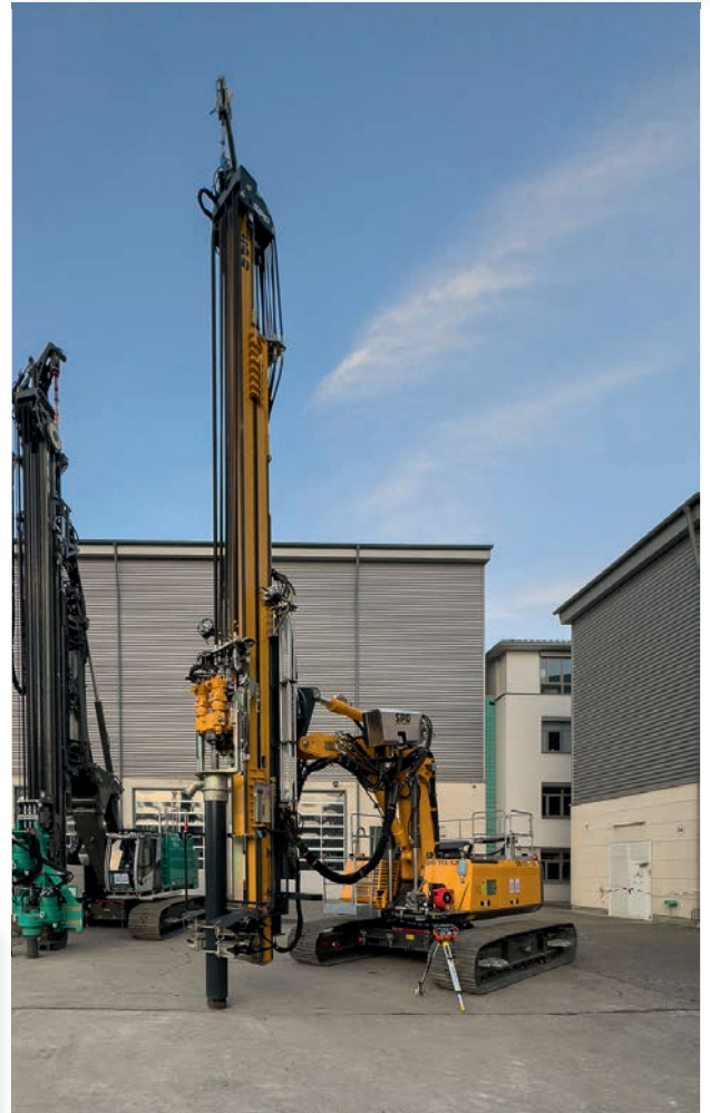
DELMAG Drehbohranlagen. Von groß bis klein RH 38 mit Kellybohrantrieb und einem Kastenbohrer, RH 34 mit VDW-Ausrüstung und das kompakte Modell RH 14 mit Kellybohr-Ausrüstung